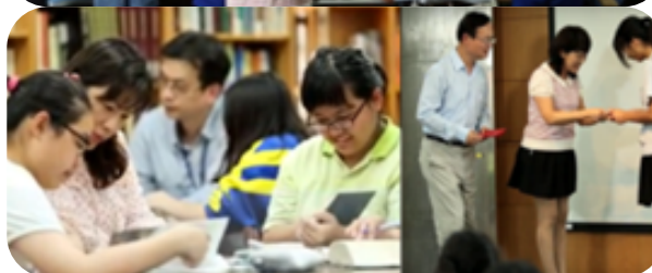
捐贈公司節能產品、伴讀研習，贊助獎學金及清寒營養午餐