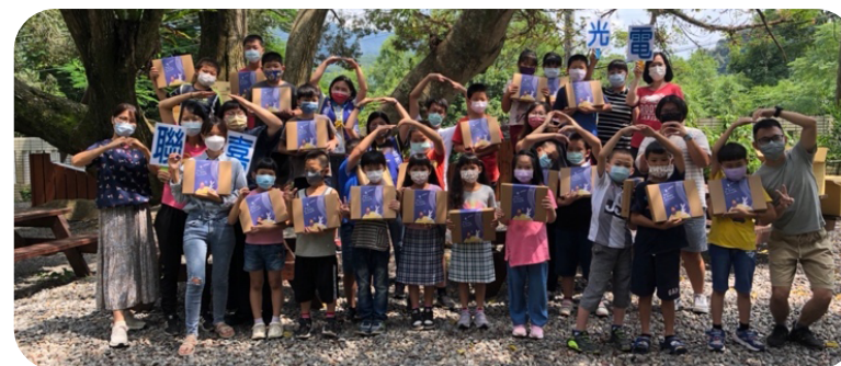
2022 中秋佳節送禮 -1

支持在地小農為友善環境、扶助小農發展，2022 年聯嘉光電向在地小農採購農產並與正職員工、美門社區關懷協會、財團法人新竹縣天主教世光教養院、財團法人高雄市私立基督教山地育幼院分享美味中秋禮盒，共度中秋佳節！