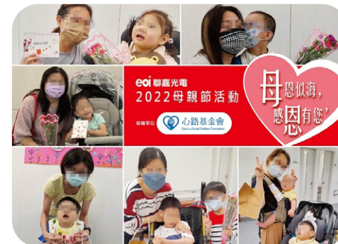
2022 年母親節活動 - 贈與蛋糕及卡片給心路基金會