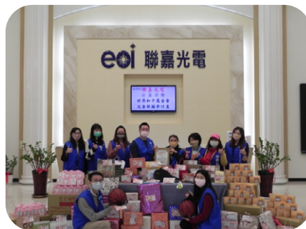
2022 兒童節圓夢傳愛 -2