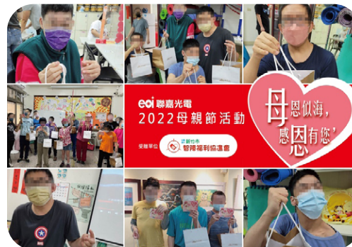
2022 年母親節活動 - 贈與蛋糕及卡片給新竹智協

向愛盲基金會採購母親節蛋糕，並轉贈送給新竹市智障協進會與心路基金會（早療中心）之母親！