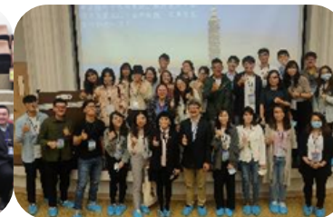
支持教育機構企業參訪：政大科智所