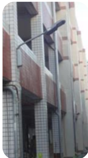
捐贈 LED 路燈提升校園安全

提供未來政府全球光電產業發展趨勢、給予國家科技產業發展策略與方向之建議，而青年學子是國家社會未來的棟樑，聯嘉光電透過產業實務與學校教育的結合，以期培育未來人才。