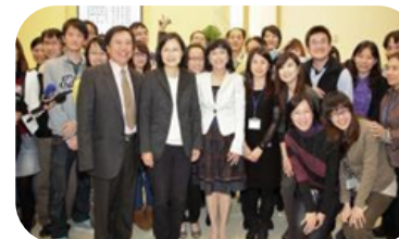
贊助支持論壇活動、提供產業發展建言