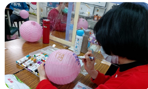
2022 元宵燈籠捐贈 -2