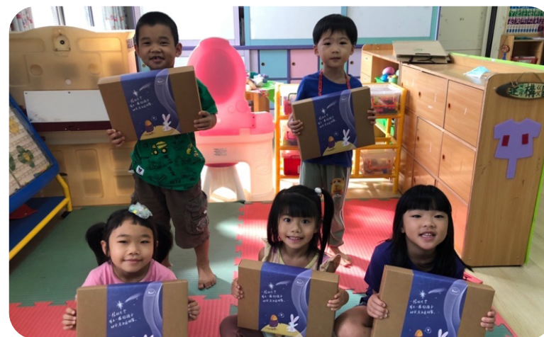
2022 中秋佳節送禮 -2