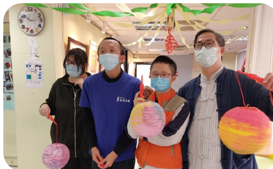
2022 元宵燈籠捐贈 -1

聯嘉光電分享燈籠給仁愛基金會、社團法人智障福利協進會及罕病基金會等友好團體上百個愛心燈籠。既能自行彩繪，也有 LED 裝置能直接提上街，與寶貝孩子們一起亮麗地歡慶佳節！