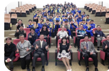
支持教育機構企業參訪：大理高中