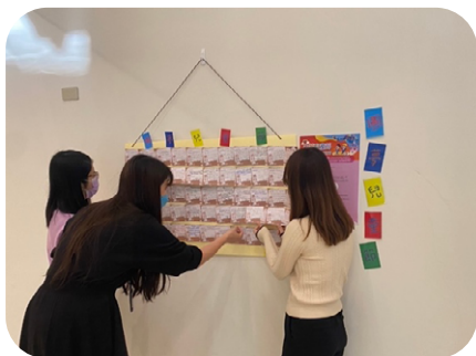
2022 兒童節圓夢傳愛 -1

聯嘉光電發起「兒童節圓夢傳愛公益活動」，邀請同仁們擔任家庭經濟弱勢孩子們的專屬天使，攜手幫助弱勢的孩子們圓夢，一起發揮愛心，認養文具包與小朋友心願禮，讓孩子們的小小夢想得以實現！此外，世界和平會的愛心文具包，則是讓貧弱孩子們能夠擁有屬於自己的新文具，認養也是相當熱烈。不到幾天，同仁們就已經認養超過上百份，幫助了 20 多所小學的孩童們。聯嘉光電職福會也共襄盛舉，再加碼捐贈防疫物資，口罩及精油香皂，讓苗栗地區偏鄉與貧窮家庭學童能有一個充滿祝福溫馨的兒童節！