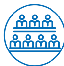
股東與 其他投資人

最終 2022 年度鑑別出聯嘉光電的利害關係人包括股東與其他投資人、金融機構、員工、客戶、供應商、政府、學術單位、媒體，以及與前一年相比新增了當地社區，作為本公司今年度重要利害關係人，共有 9 類。